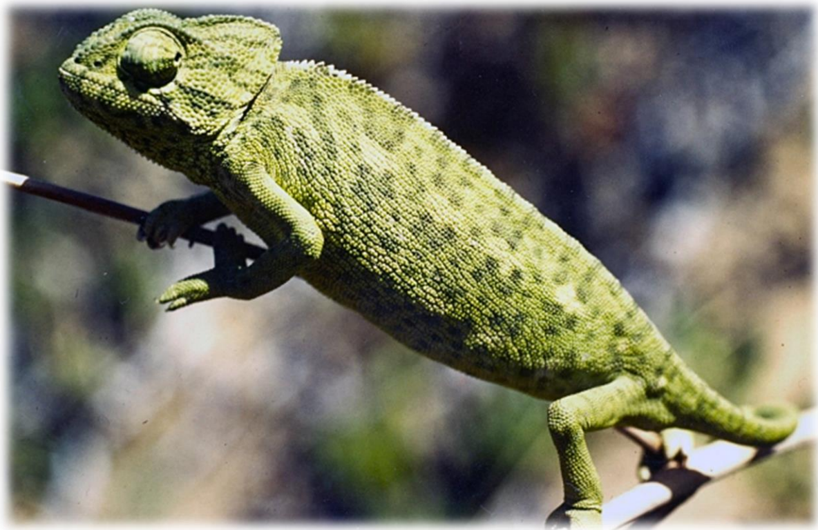
De Mediterrane kameleon ( Chamaeleo chamaeleon ) is een hagedissoort die in ieder geval voorkomt op de Griekse eilanden Samos, Kreta en Chios. In het verleden was het verspreidingsgebied waarschijnlijk groter maar de waarnemingen van de afgelopen jaren