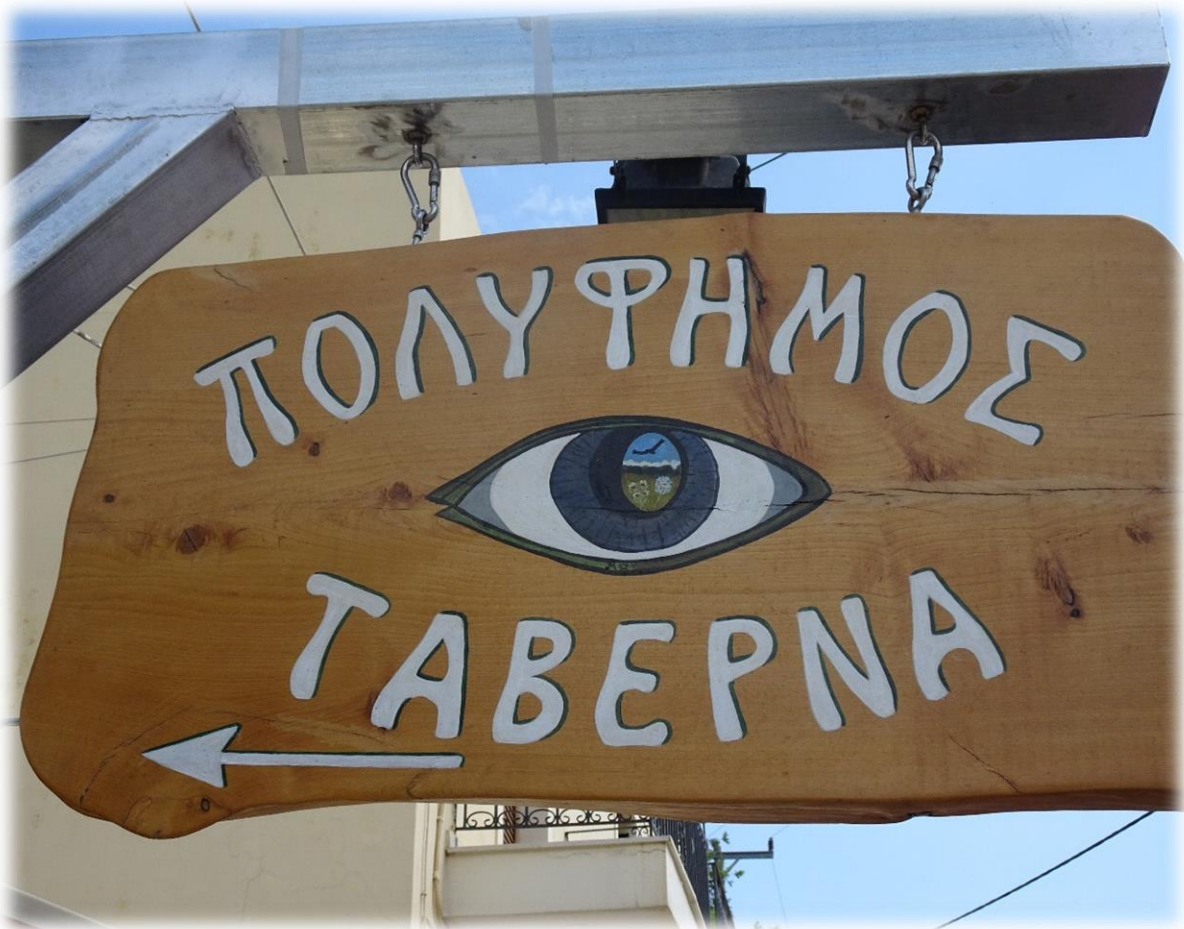
Na onze wandeling doen we een tarrasje in Sougia, in de bar Polifimos.