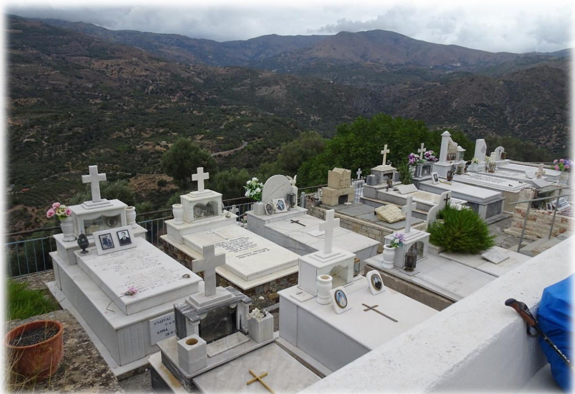
Op weg naar Sougia passeren we een klein kerkhof dat we even gaan bezoeken. De graven zijn hier bovengronds.