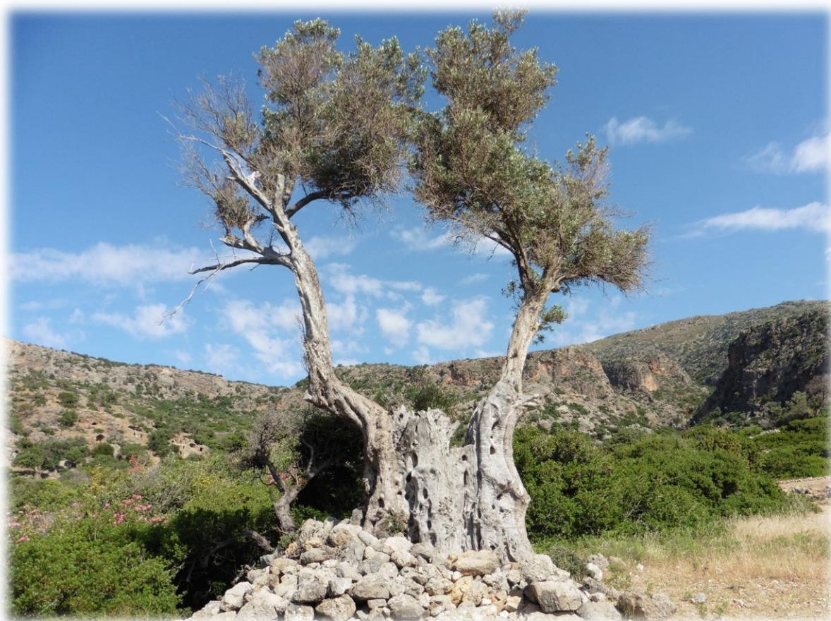
Het antieke Lissos ligt prachtig genesteld in een kleine baai. Dankzij de bronnen groeide deze oude stad, tijdens de Dorische periode, uit tot een welvarend kuuroord.