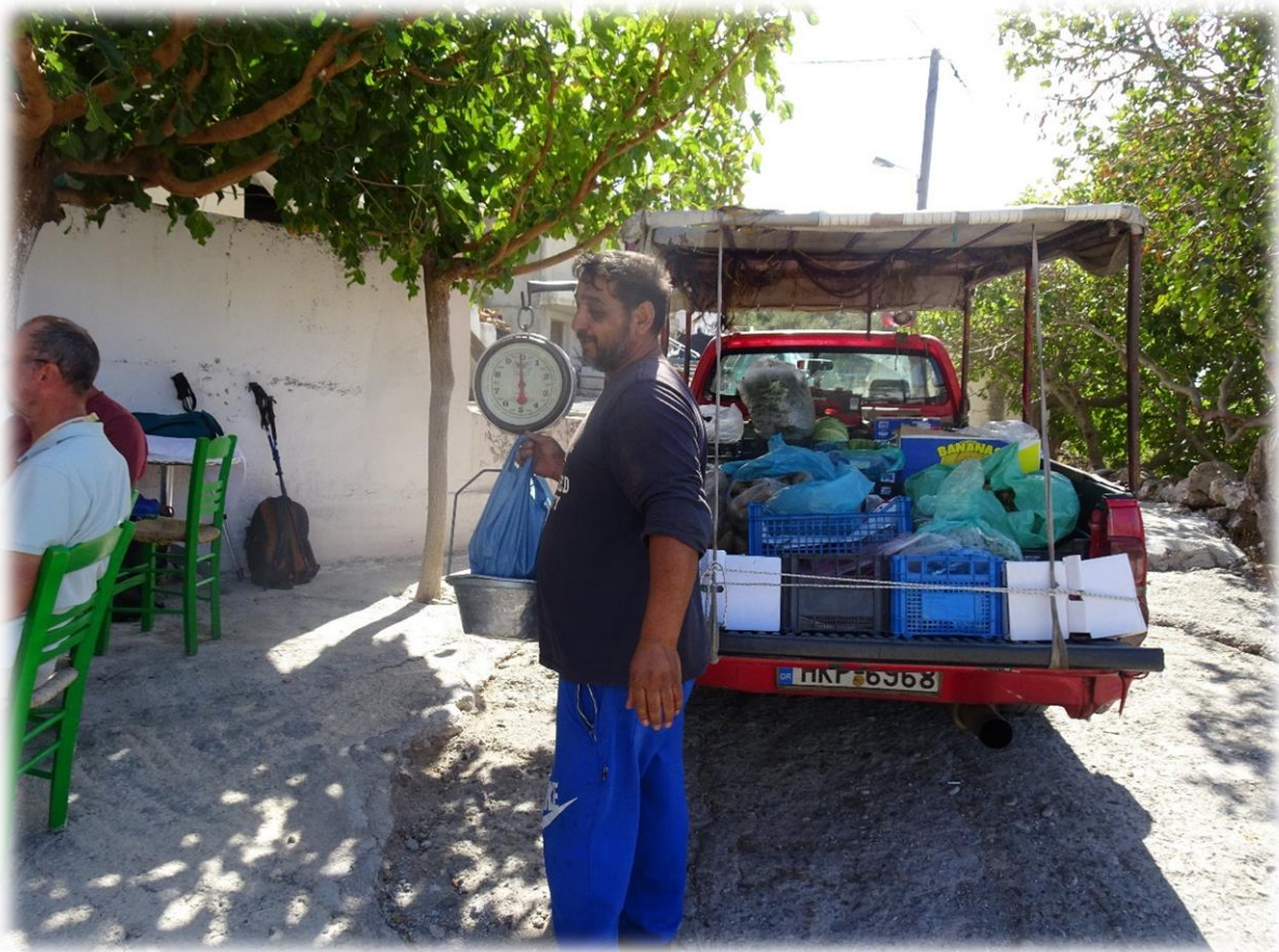
In het dorpje Koustogerako doen we een terrasje (al was het café dicht). Ook de rijdende groenteboer ben ik er ooit al tegengekomen.