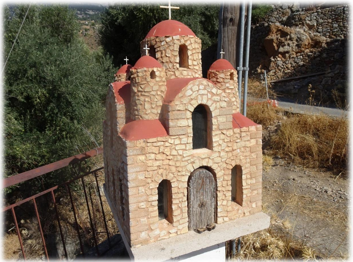
Ook hier een herdenkingskapelletje voor een jonge twintiger die tijdens de oorlog werd doodgeschoten op verdenking van samenzwering.