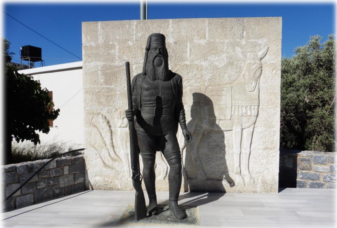
Deze stoere man, geboren en getogen in Koustogerako (een naburige gemeente van Sougia), heeft met zijn leger gedurende 2 jaar gevochten tegen indringers. Zijn naam kan ik echter niet uitspreken, laat staan dat ik hem zou kunnen schrijven.