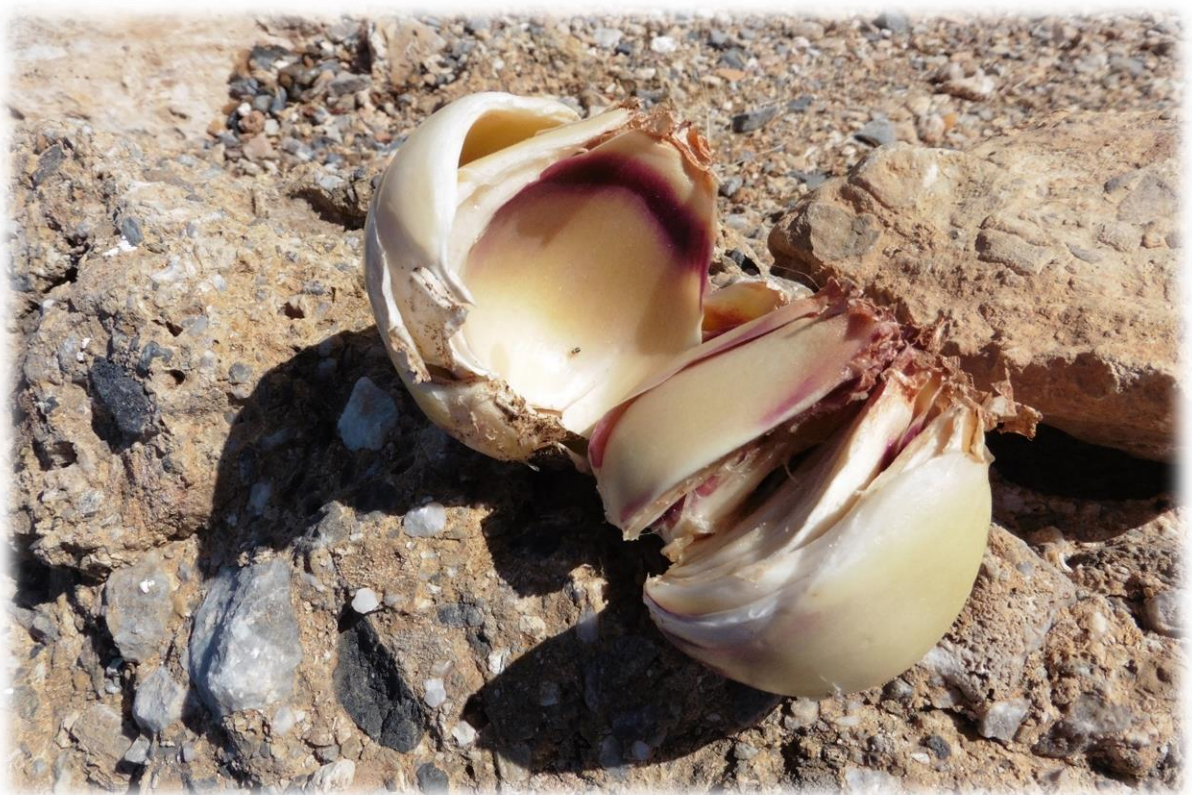
De zeeajuin tiert hier welig en staat nu in het einde van zijn bloei. De plant is giftig en smaakt zeer bitter. In de oudheid werd de zeeui gebruikt als ratten- en muizengif. De bloemen kunnen als snijbloemen gebruikt worden en de bol kan wel meer dan 7kg wegen.